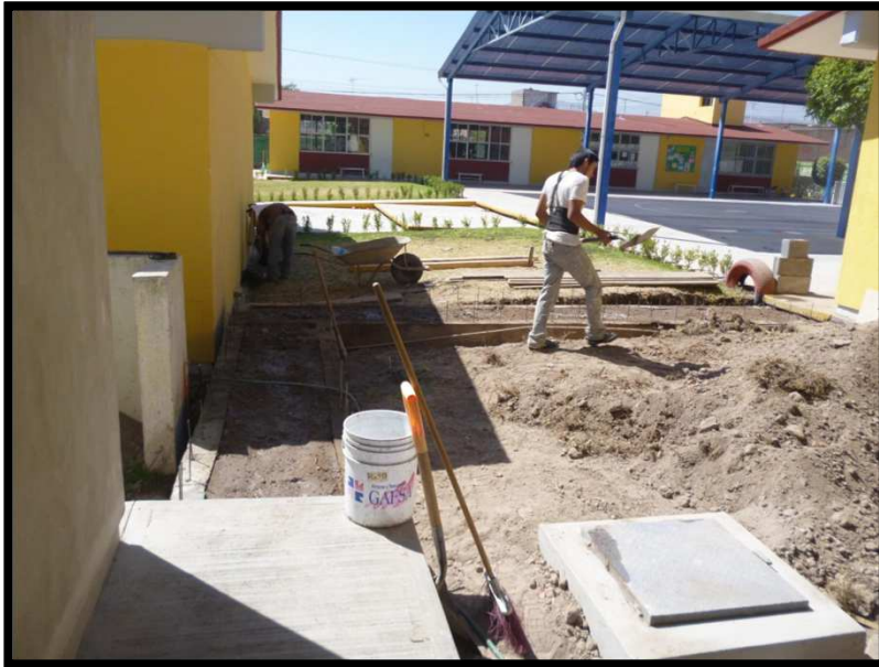
JN VALENTIN GOMEZ FARIAS COL. SIMON DIAZ, SAN LUIS POTOSI, S.L.P. CONSTRUCCION DE UN AULA DIDACTICA ESTRUCTURA REGIONAL 6.00 X 8.00, OBRAS EXTERIORES Y REHABILITACION GENERAL DE LA INFRAESTRUCTURA DEL PLANTEL