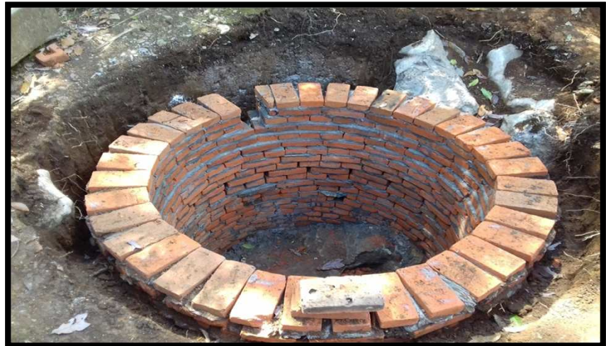
EP BENITO JUAREZ BARRIO DE LAS GOLONDRINAS, AQUISMÓN, S.L.P. MEJORA DE LA INFRAESTRUCTURA FISICA EDUCATIVA DEL PLANTEL