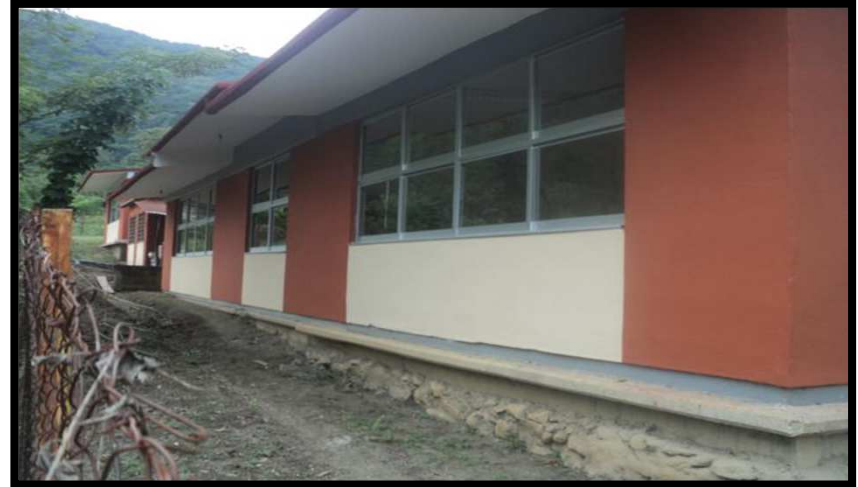
JN FRIDA KAHLO SAN PEDRO DE LAS ANONAS, AQUISMÓN, S.L.P. REHABILITACION EN LA INFRAESTRUCTURA FISICA DEL PLANTEL