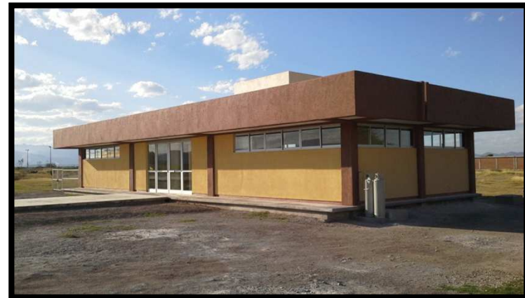
INSTITUTO TECNOLOGICO SUPERIOR DE RIOVERDE RIOVERDE,S.L.P. CONSTRUCCION DE LA 1a. ETAPA DEL LABORATORIO BASICO DE BIOQUIMICA