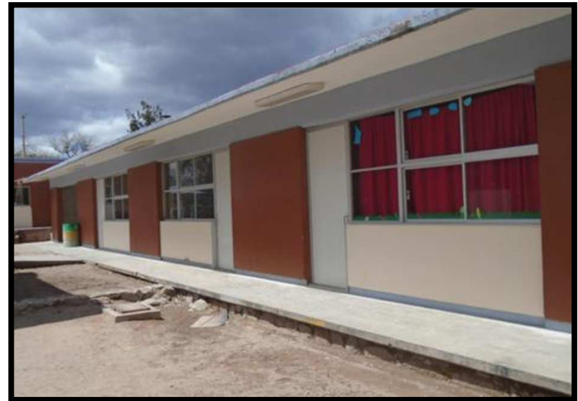
EP VICENTE GUERRERO SAN PEDRO OJO ZARCO, MEXQUITIC DE CARMONA, S.L.P. REHABILITACION GENERAL DE LA INFRAESTRUCTURA FISICA DEL PLANTEL