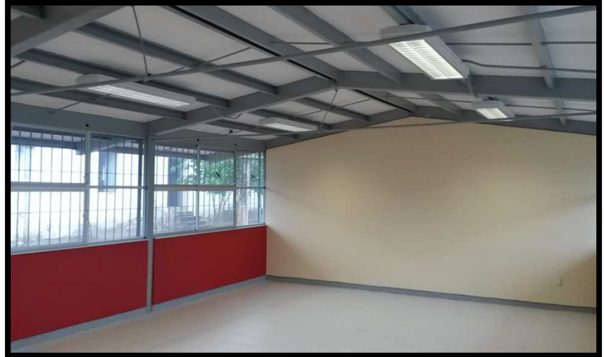
EP ALBA ROJA EL PAJARITO, RAYÓN, S.L.P. REHABILITACION DEL EDIFICIO C, ESTRUCTURA A-70 6 ENTREEJES