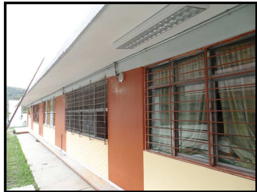
SECUNDARIA TECNICA No. 85 CHAPULHUACANITO TAMAZUNCHALE, S.L.P. REHABILITACION GENERAL DEL PLANTEL Y CONSTRUCCION DE MURO DE CONTENCIÓN