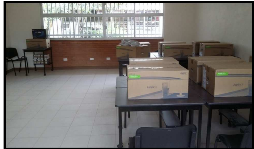
EP BENITO JUAREZ VENADO, S.L.P. CONSTRUCCION Y EQUIPAMIENTO DE UN AULA DE COMPUTO, ESTRUCTURA REGIONAL 6.00 X 8.00 M Y OBRAS EXTERIORES