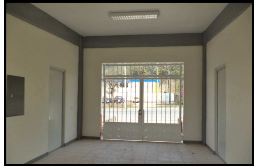
CISDEPI NO. 15 (CENTRO DE INTEGRACION SOCIAL PARA EL DESARROLLO DE LOS PUEBLOS INDIGENAS) COLONIA AHUEHUEYO II MATLAPA, S.L.P. REHABILITACION GENERAL DE LA INFRAESTRUCTURA