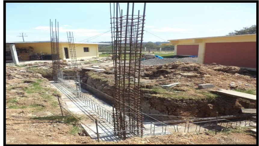
ESCUELA NORMAL DE LA HUASTECA POTOSINA LA CUCHILLA, CARRETERA TAMAZUNCHALE-SAN MARTIN CHALCHICUAUTLA KM 7, TAMAZUNCHALE, S.L.P. 1a ETAPA DE CONSTRUCCION DE MODULO DE SERVICIO SANITARIO ESTRUCTURA U-1C