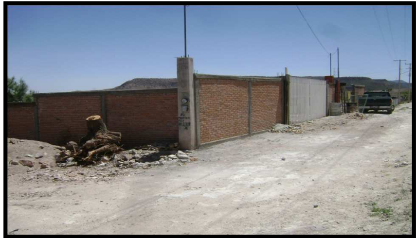
JN PABLO NERUDA POZUELOS, SAN LUIS POTOSÍ, S.L.P. MEJORA DE LA INFRAESTRUCTURA FISICA EDUCATIVA DEL PLANTEL