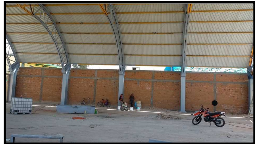
GIMNASIO AUDITORIO DEL S.E.E.R., PREPARATORIA POR COOPERACION FRANCISCO MARTINEZ DE LA VEGA BARRIO DE SANTIAGO SAN LUIS POTOSI, S.L.P. 1a, ETAPA DE REHABILITACION Y CONCLUSION DE LA CONSTRUCCION DEL GIMNASIO AUDITORIO DEL S.E.E.R. (ESTRUCTURA METALICA Y CUBIERTA)