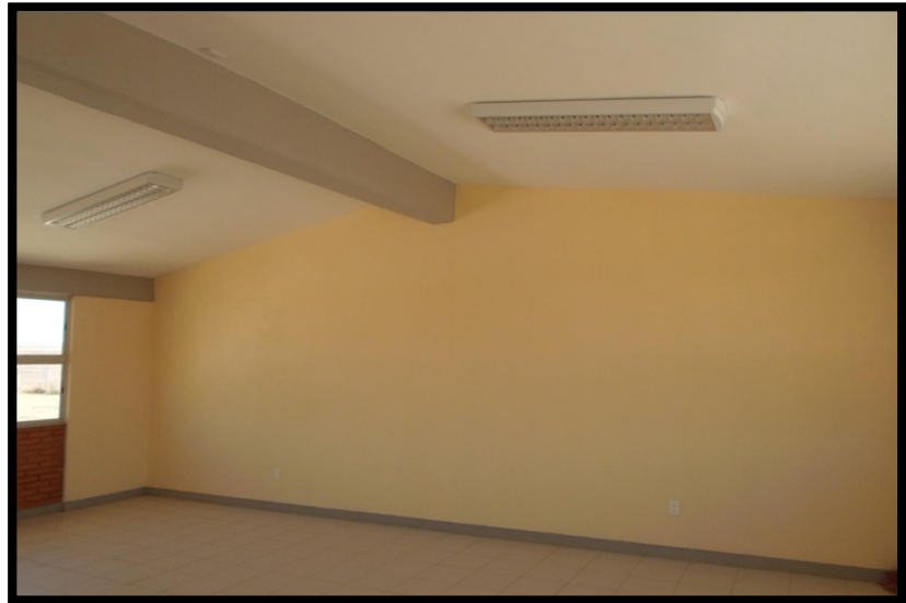
JN ROSA MARIA CARRANZA MOROLEON SOLEDAD DE GRACIANO SANCHEZ, S.L.P. CONSTRUCCION DE UN AULA DIDACTICA, ESTRUCTURA REGIONAL 6.00 X 8.00 Y OBRAS EXTERIORES