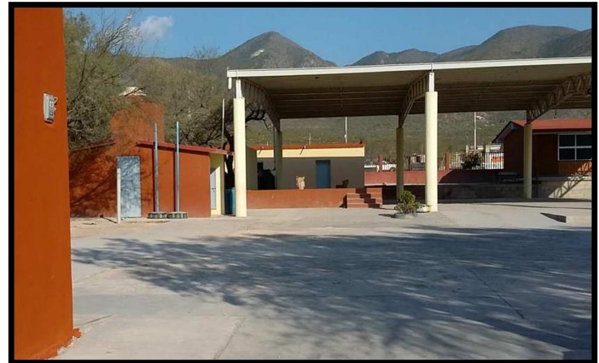
EP FRANCISCO GONZALEZ BOCANEGRA NUÑEZ GUADALCAZAR, S.L.P. REHABILITACION