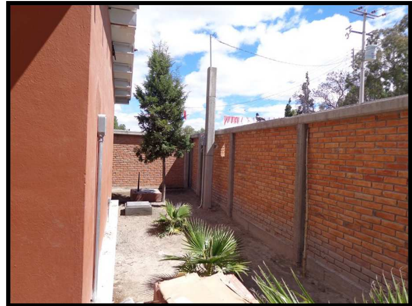
JN ANTONIO OTAHEGUI OJO DE AGUA DEL GATO, VILLA DE REYES, S.L.P. RAHABILITACION GENERAL DE LA INFRAESTRUCTURA FISICA DEL PLANTEL