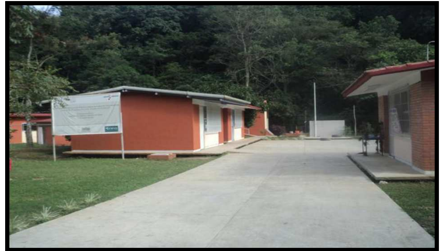
JNI BENITO JUAREZ MANTE TZULEL (MANTEZULEL), AQUISMÓN, S.L.P. REHABILITACION EN LA INFRAESTRUCTURA FISICA DEL PLANTEL