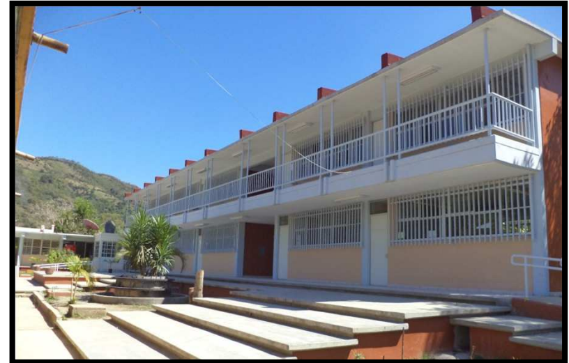
SECUNDARIA GENERAL BELISARIO DOMINGUEZ MATLAPA, S.L.P. REHABILITACION GENERAL DEL PLANTEL