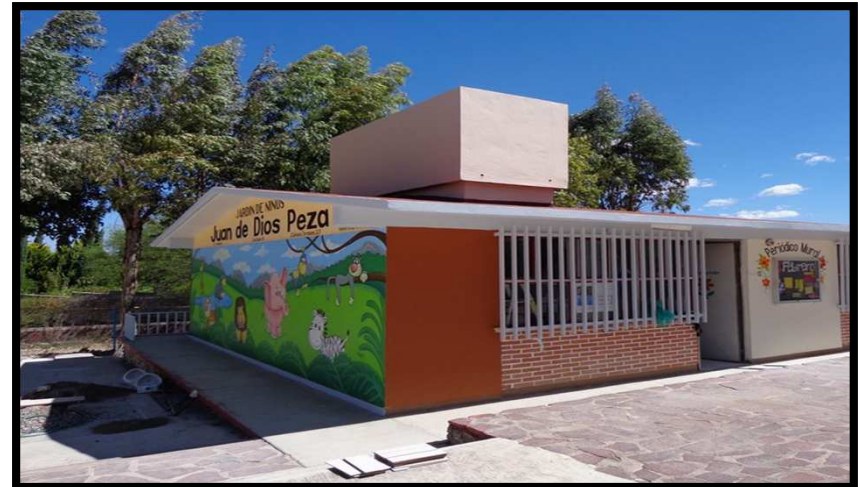
JN JUAN DE DIOS PEZA BARRIO EL SANTUARIO, TIERRA NUEVA, S.L.P. REHABILITACION GENERAL DE LA INFRAESTRUCTURA FISICA DEL PLANTEL