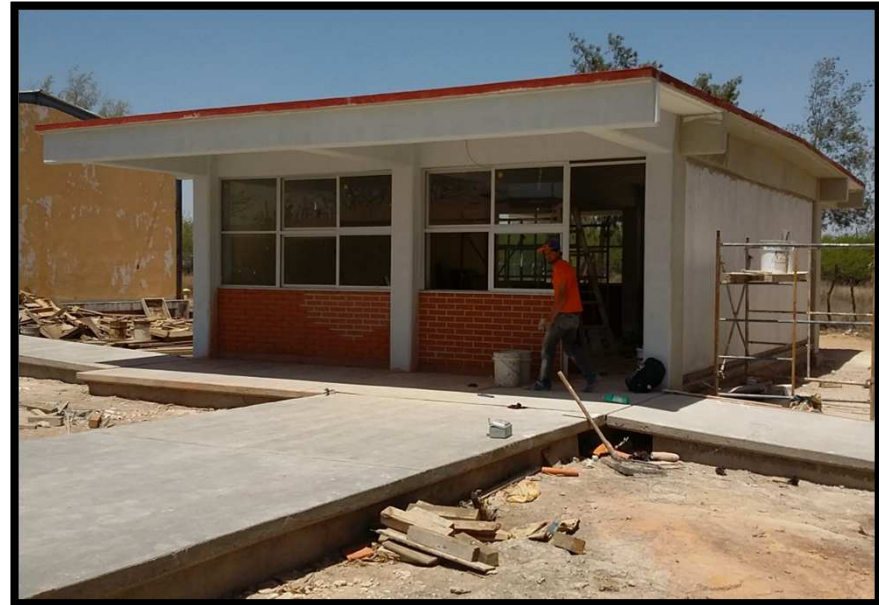
SEC TECNICA NO 54 BUENAVISTA GUADALCAZAR, S.L.P. CONSTRUCCION DE AULA